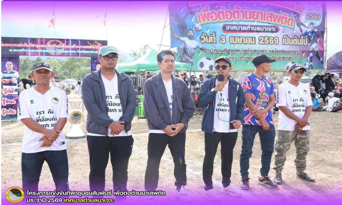
โครงการแข่งขันกีฬาชุมชนสัมพันธ์ เพื่อต่อต้านยาเสพติด ประจำปี 2569 เทศบาลตำบลลาเจาะ