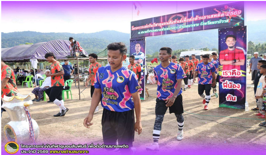
โครงการแข่งขันกีฬาชุมชนสัมพันธ์ เพื่อต่อต้านยาเสพติด ประจำปี 2569 เทศบาลตำบลลาเจาะ